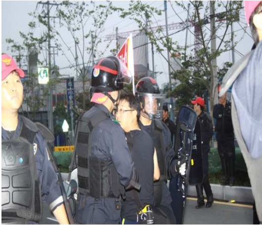
경찰의 통행제한에 항의하는 참가자 연행

1999년의 대법원 판례에서 “증거보전의 필요성 및 긴급성이 있고, 일반적으로 허용되는 상당한 방법에 의하여 촬영을 한 경우”에 한해 영장 없는 촬영을 허용할 정도로 엄격하게 그 범위를 제한하고 있다. 그러나 3차 희망의 버스에 대한 경찰의 채증은 인도로 통행중인 시민, 통행제한에 대해 항의하는 시민, 종교행사를 끝마치고 해산하려는 참가자등 대법원 판례에서 벗어나 무차별적 증거수집에 불과하였다.