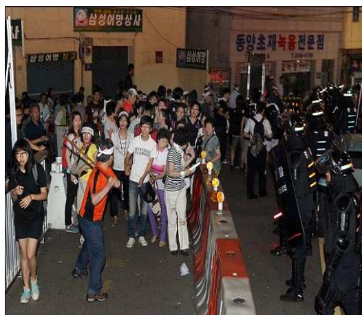
목검을 든 어버이연합회원 인도의 시민들폭력을 행사하고 있다. 바로 옆의 경찰은 이를 제지하지 않고 있다.