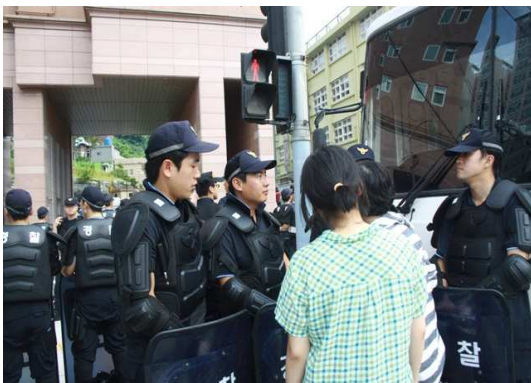
집회참가자에 대한 통행차단하는 경찰

따라서 경찰관은 형사처벌의 대상이 되는 행위가 눈앞에서 막 이루어지려고 하는 것이 객관적으로 인정될 수 있는 상황이고, 그 행위를 당장 제지하지 않으면 곧 인명·신체에 위해를 미치거나 재산에 중대한 손해를 끼칠 우려가 있는 상황이어서, 직접 제지하는 방법 외에는 위와 같은 결과를 막을 수 없는 절박한 사태일 때에만 경찰관직무집행법 제6조 제1항에 의하여 적법하게 그 행위를 제지할 수 있고, 그 범위 내에서만 경찰관의 제지 조치가 적법한 직무집행으로 평가될 수 있는 것이다.