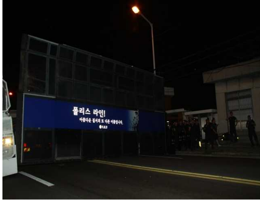
대선조선 2공장 앞을 차단한 경찰차벽