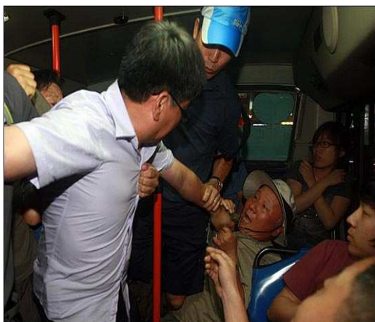
어버이연합회원이 82번 버스에 탑승한 승객의 목살을 잡고 끌어내리려 하고 있다

30일 경찰은 영도대교에서 검문검색을 실시하고 있었음에도 불구하고 위와 같은 폭력행위를 제지하지 않고 관망하였다.