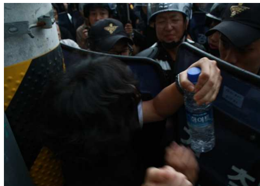
신도브레뉴연 종교행사참가자를 20분간 불법감금한 경찰에 참가자가 항의하고 있다.