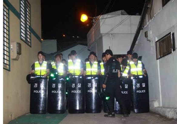
대선조선 2공장 방향 길 차단중인 경찰병력